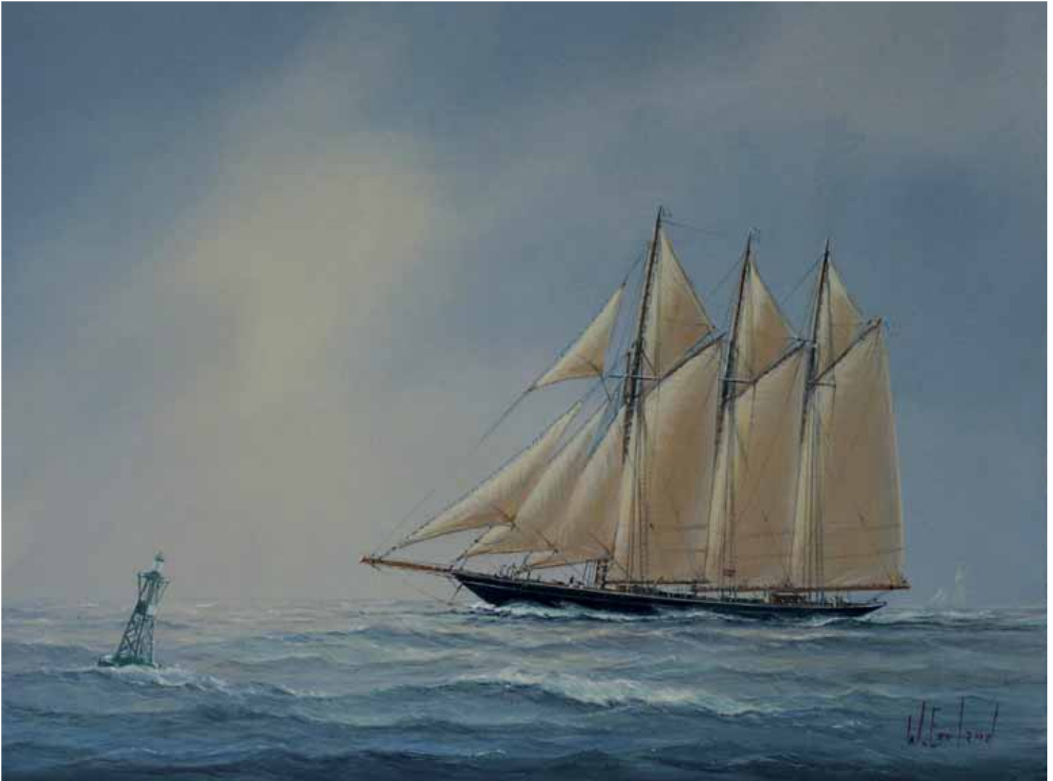
Zeeschilder Willem Eerland liet zich inspireren door het historische verhaal van de Atlantic.