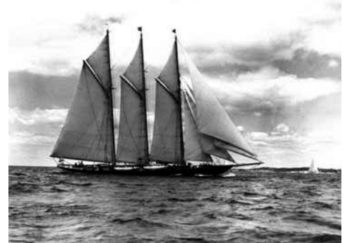
De Atlantic onder vol tuig in 1903.

Hij zou zijn geld in de horeca verdienen en daarmee kon hij zijn dromen verwezenlijken.