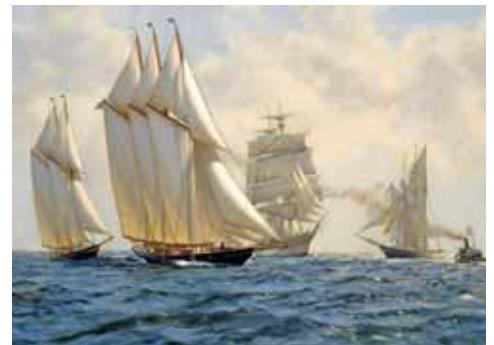
Het originele schilderij van de Atlantic in de race in 1905, vastgelegd door T.D. Blake.

Hij was - van zijn moederskant - een nakomeling van de oprichters van de Holland-Amerika Lijn. Zijn vader kwam uit een vissersfamilie. Het kon dus niet uitblijven dat hij de maritieme wereld opgetogen binnenstapte. Op 12-jarige leeftijd bouwde hij zijn eerste kano. Twee jaar later zeilde hij in een Sharpie toen hij zestien was, knapte hij zijn eerste boot op.