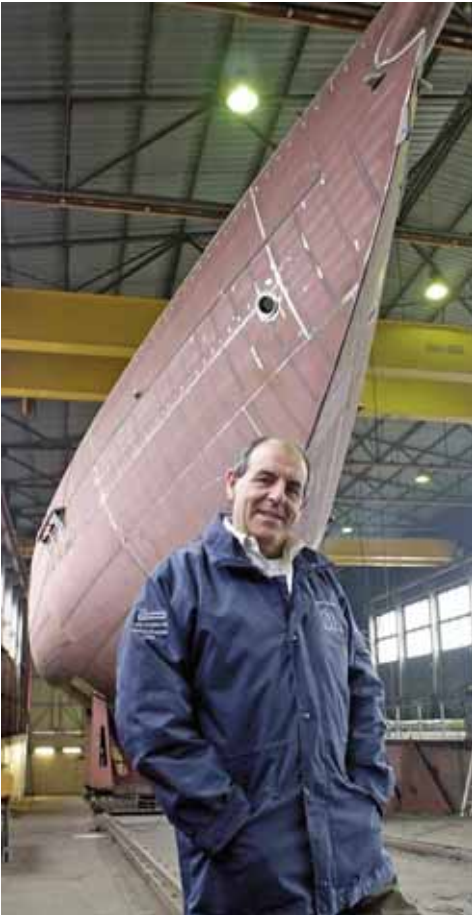
Van der Graaf in Hardinxveld Giessendam bouwde het casco.