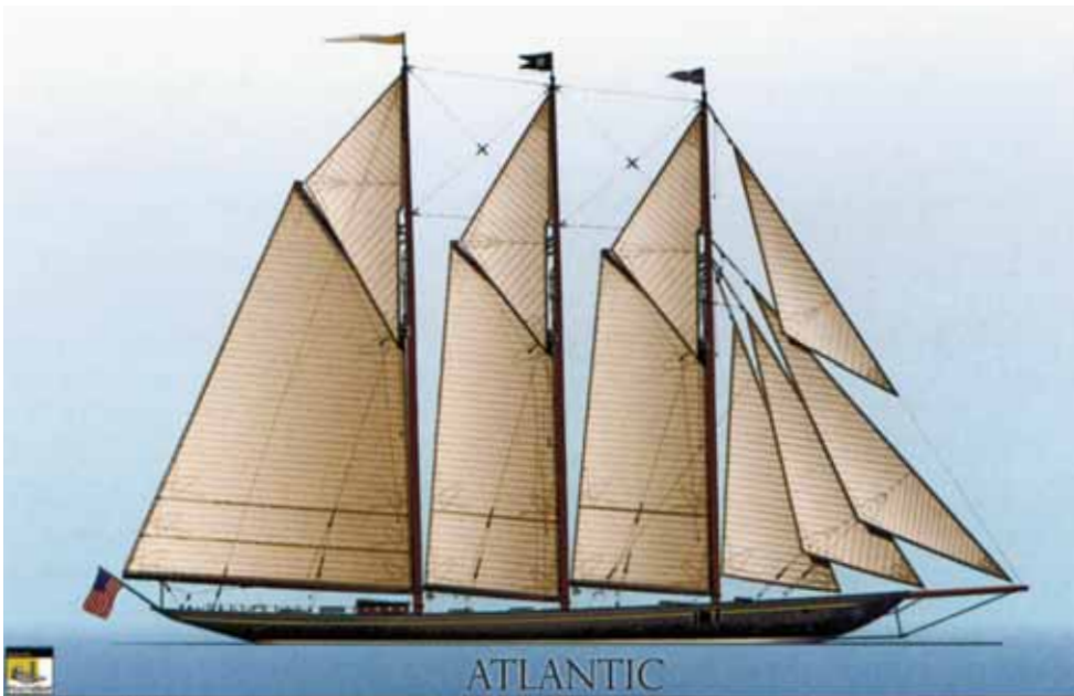
Het zeilplan van de Atlantic.

Linksonder: De bemanning op de boegspriet om de voorzeilen op te doen.